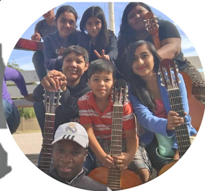
Poblado Miguel Alemán