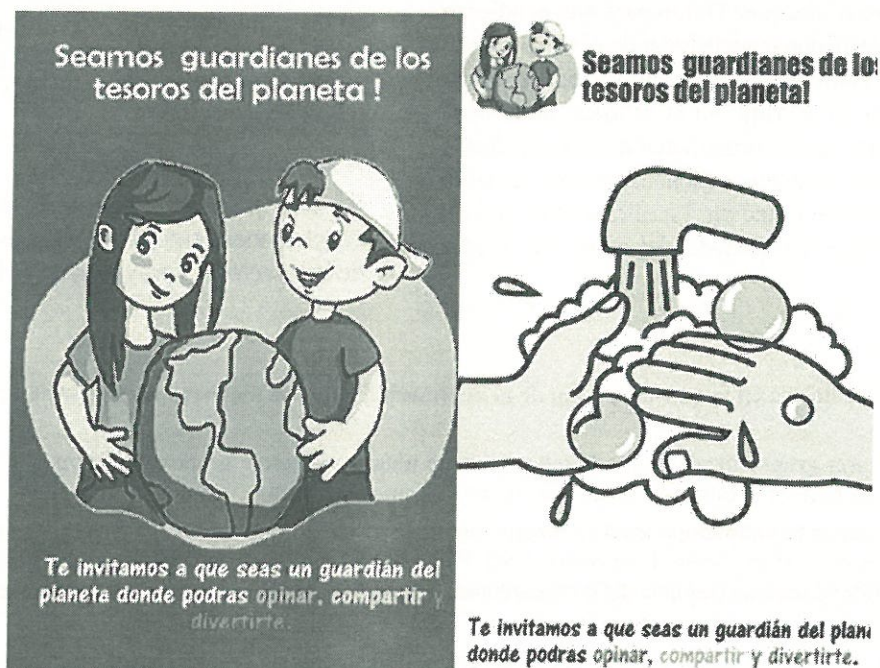
Pósteres promocionales de la fase inicial del proyecto.

Se ha confeccionado una estrategia para sensibilizar a los niños y niñas, consistente en un diseño promocional cuyo lema es “Guardianes del Planeta”, en el cual se realizarán carteles promocionales para ser colocados en distintos puntos de la escuela, a efecto de atraer la participación durante la primera actividad: una obra de teatro que vincula información relativa al cuidado del agua con diversos personajes, cuyo protagonista es un personaje identificado como “guardián del planeta” que, al término de la obra, insta a los niños a que se sumen al “Club de los Guardianes del Planeta”. Posteriormente, mediante este lema, se difunden y realizan los grupos focales.